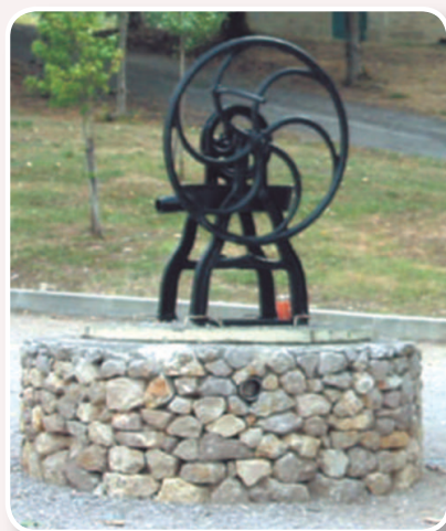
▲ Magnifique «Pompe à Chapelet»

Extrait des cartes IGN 1/25.000 série bleue n°2140 Ouest - © IGN - Paris - 2011. Autorisation N° 221133