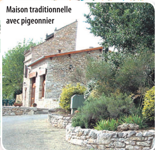
Maison traditionnelle avec pigeonnier