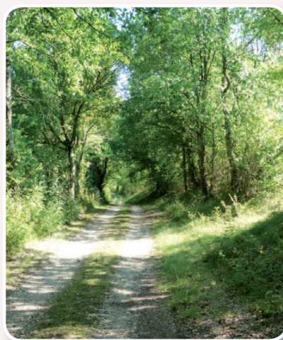
▲ Chemin ombragé de St-Cirq